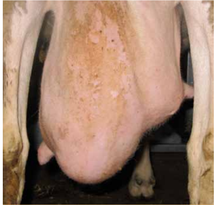
Las asimetrías observadas son resultado de pérdida de tejido mamario por lesión, bien de infecciones pasadas o presentes en el momento.

Relacionando las lesiones observadas con los datos individuales de RCS del C.L.O., se constató que, en el caso de asimetrías, el 45% de las hembras con esta lesión mostraban recuentos superiores al millón de células/ml. Un 13,7 % de las hembras en las que se detectaron nodulaciones también superaban ese umbral y un 6% de las hembras que presentaban bultos en una o ambas mamas.